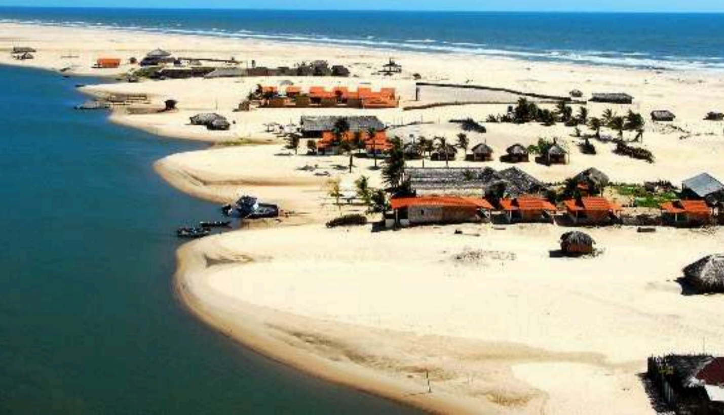
Praia de Caburé